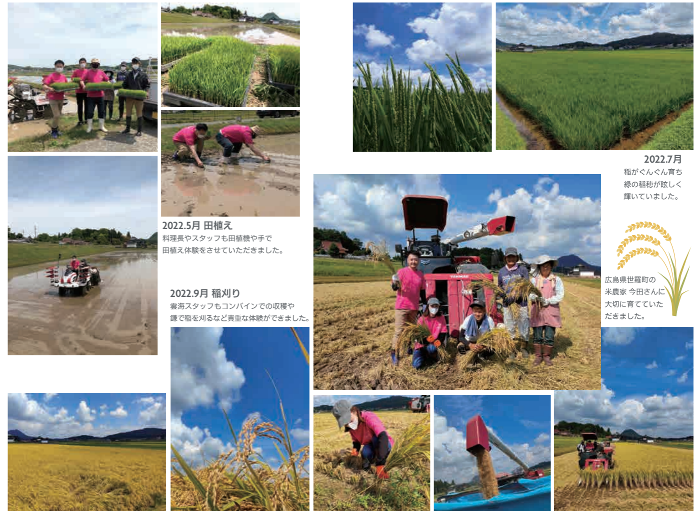
2022.7月 稲がぐんぐん育ち 緑の稲穂が眩しく 輝いていました。